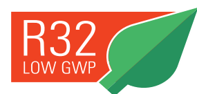
Nuevo refrigerante ecológico R32

Vitoclima 200-S dispone de un modo de funcionamiento silencioso que se puede activar para que el caudal de aire sea débil. En este modo, se seleccionan las velocidades más bajas, lo que permite que el aparato sea prácticamente inaudible con un nivel de presión sonora reducido hasta 21 dB(A).