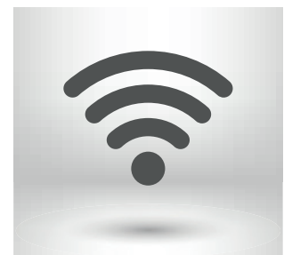
Wi-Fi- Control remoto de la bomba de calor aire/aire