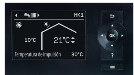
Control del Vitovent 300-C a través de la unidad del regulador de la bomba de calor Vitotronic 200, tipo WO1C