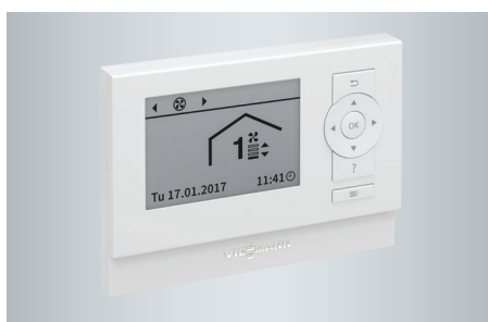
Unidad de control de ventilación, tipo LB1