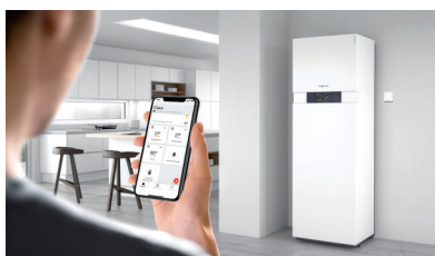
App ViCare, aplicación gratuita para controlar cómodamente la bomba de calor desde un smartphone.

Con la interfaz de Internet Vitoconnect (opcional), las bombas de calor Vitocal 100-S/111-S pueden conectarse a internet. A través de la App ViCare gratuita, es posible gestionar remotamente desde un smartphone muchas de las funciones como p.ej. la regulación de la temperatura ambiente, horario y A.C.S.