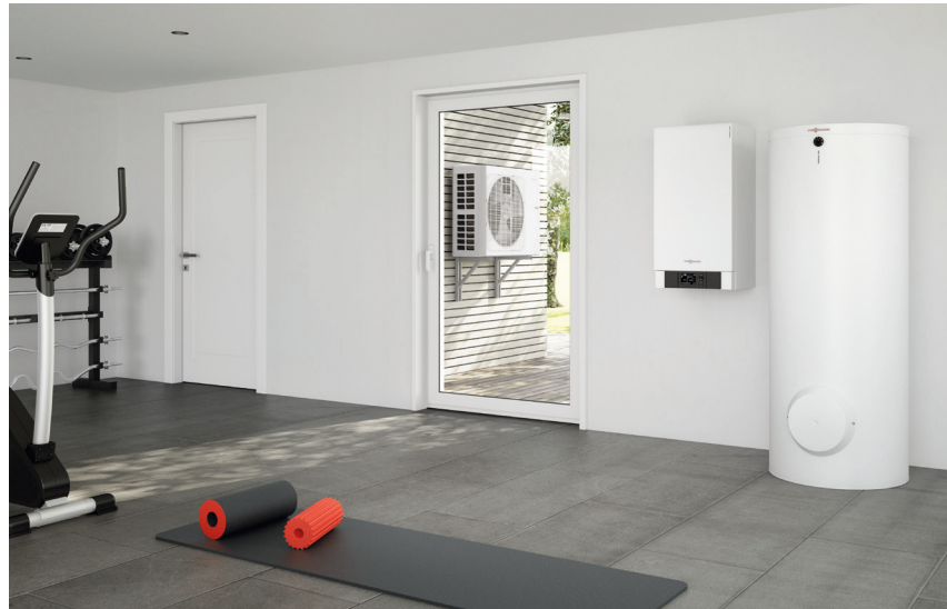
Bomba de calor aire-agua split Vitocal 100-S, interacumulador de ACS Vitocell (derecha) y unidad exterior

En obra nueva o reforma, es la solución ideal y eficiente para refrigeración, calefacción y agua caliente sanitaria.