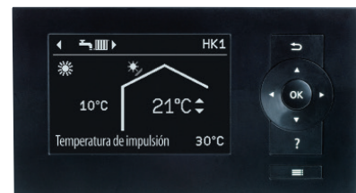
Regulación de la bomba de calor Vitotronic 200

Vitocal 100-S y Vitocal 111-S están disponibles en distintas variantes para responder a necesidades diversas. Como bomba de calor sólo para calefacción y producción de ACS (modelos AWB-M) o con resistencia eléctrica integrada (modelos AWB-M-E) así como con posibilidad de refrigeración con la función "active cooling" para una agradable regulación de la temperatura ambiente en los meses de verano (modelos AWB-M-E-AC).